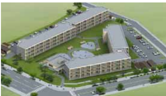
【根室市であえ～る明治団地】

子育てに配慮した仕様の公営住宅として、入居者や地域の子育て世帯が集う集会所・広場を併設した「道営子育て支援住宅」を整備。集会所等を活用し、子育てアドバイザーによる子育て相談・援助等の子育て支援サービスを提供している。