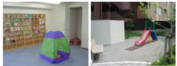
【キッズルームとプレイロット】

プレイロットの整備：面積が40㎡以上あること、児童が安全に遊ぶことができるよう区画されていること、舗装部分については透水性であること