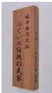
【「ふくい伝統的民家」認定民家と認定証】