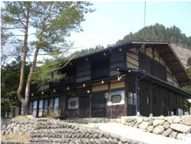
【太江田舎暮らし体験モデル住宅】