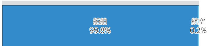
外貿輸送機関別分担率（トンベース）

船舶による貨物輸送は、外貿ではほぼ100%、内貿でも大きな割合を占めており、その活動拠点となる港湾は、我が国の経済及び国民生活を支えています。