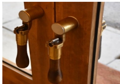
鉄道に使用されていたブレーキ ハンドルをドアノブとして再利用