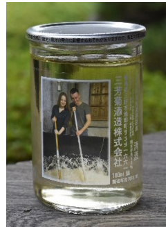
体験メニューで作成で きるオリジナルカップ に入ったお酒