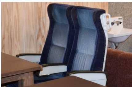
特急列車で使用していたシート をイスとして再利用