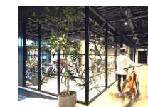
サイクリング等の目的型観光への対応