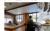
ワークショップへの対応