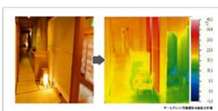
サーモグラフィーの導入