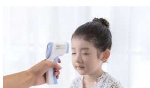
非接触体温計の導入