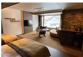
施設のリノベーション