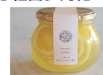
農家と連携した加工食品の販売