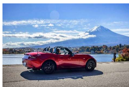
グローバルキャンペーンイメージ