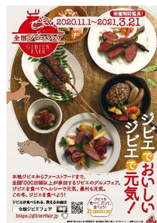
令和2年度 全国ジビエフェアポスター

捕獲から処理加工段階までの情報を共有できるネットワークシステムの構築・実証、処理加工施設でのOJTによる人材育成を実施。また、ジビエ特設ECウェブサイト（2020年（令和2年）7月に開設し、ジビエプロモーション・ジビエフェアの開催等によるジビエの需要開拓及び需要拡大に取り組むとともに、ジビエ料理コンテストの開催（2021年（令和3年）1月表彰）、全国各地の飲食店等でジビエメニューを提供するジビエフェアの開催（2020年（令和2年）11月～2021年（令和3年）3月、全国で1,100店舗以上が参加）を通じてジビエを取り入れた食事メニューの開発等を促進した。さらに、ジビエモデル地区の取組を全国の観光地域づくり法人（DMO）へ周知し、旅行商品造成を促した。