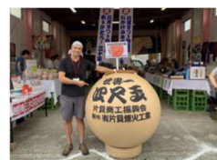
インフルエンサーによる 花火のYouTube配信