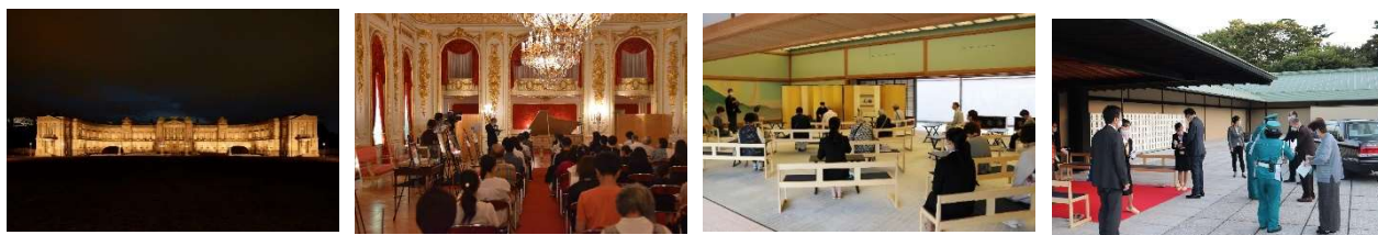
迎賓館赤坂離宮及び京都迎賓館の一般公開の状況

加えて、6箇国語 32 対応の参観アプリをウェブサイト 33 や館内で紹介・周知することで、積極的な活用促進を図った。