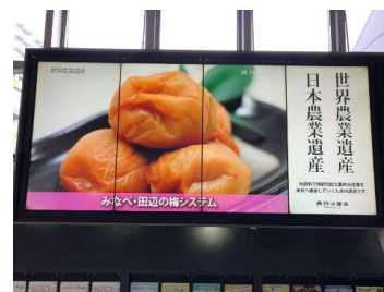
京都駅橋上マルチビジョン 農業遺産の動画放映の様子

世界農業遺産・日本農業遺産の更なる認知度向上や理解醸成を図るため、2020年（令和2年）11月にJR 渋谷駅・大宮駅・横浜駅・京都駅の駅構内及び小田急線電車内において農業遺産の動画放映等を行い、世界農業遺産・日本農業遺産への認知・関心を高め認定地域の観光振興や都市住民との交流促進に資するとともに、2021年（令和3年）1月14日に農業遺産認定地域担当者に対し、教育旅行誘致に係る情報発信等に関する研修会をオンラインにより実施した。また、世界農業遺産・日本農業遺産及び世界かんがい施設遺産を観光資源として活用するため、リーフレットやウェブサイトを作成した。