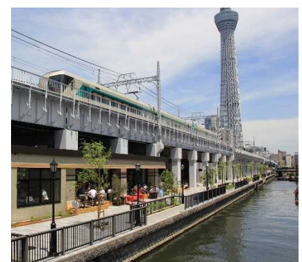
鉄道高架下施設「東京ミズマチ」 (北十間川/墨田区)

東京都の北十間川等において、公園やコミュニティ道路、親水護岸の整備に加え、東武鉄道による「東京ミズマチ」、「すみだリバーウォーク」の整備等、官民が地元の思いを共有し一体的な空間づくりを進めており、河川敷地占用許可準則の緩和措置等により、民間事業者による商業活動等と一体となった良好な水辺空間の形成を図った。2020年度（令和2年度）のかわまちづくり登録数は9箇所、累計238箇所となった。