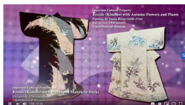
VRなどの最先端技術を活用した 映像コンテンツ発信