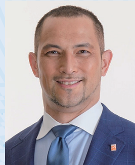
スポーツ庁長官 室伏 広治