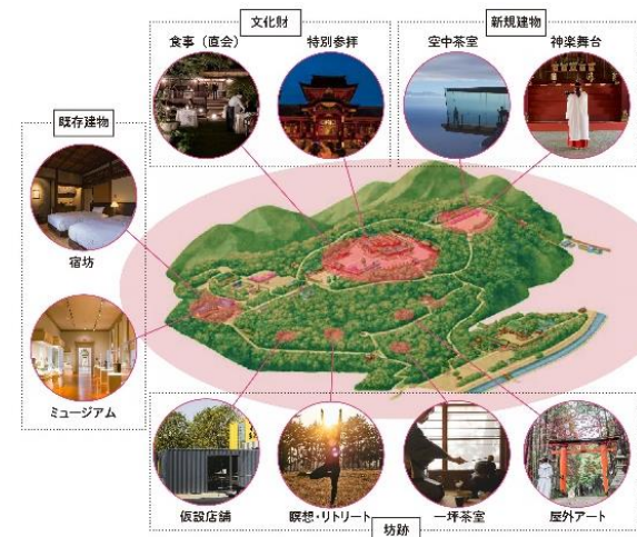
面的なレガシー形成のイメージ