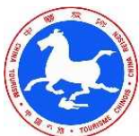
中国駐東京観光代表処