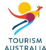
オーストラリア政府観光局