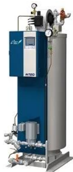
省エネ型ボイラー