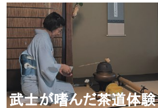
武士が嗜んだ茶道体験