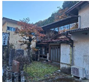
歴史的建築物の保存・整備と観光拠点等への活用 (神奈川県伊勢原市)