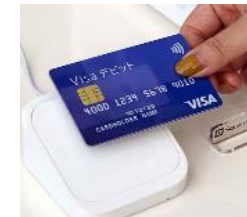
キャッシュレス決済環境