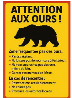
多言語による情報発信