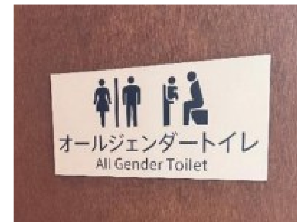
万博会場に設置された オールジェンダートイレの表示