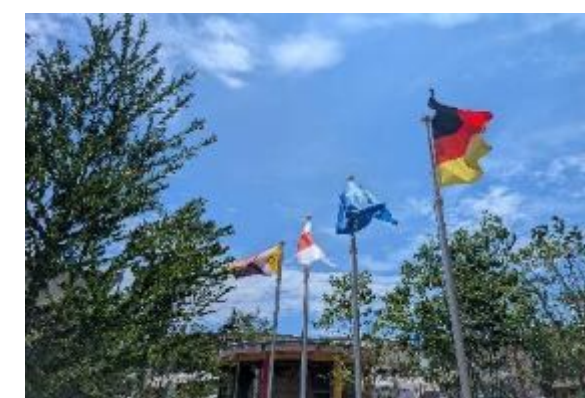
ドイツパビリオン