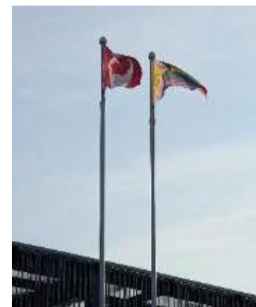
カナダパビリオン