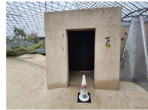
万博会場に設置された祈禱室