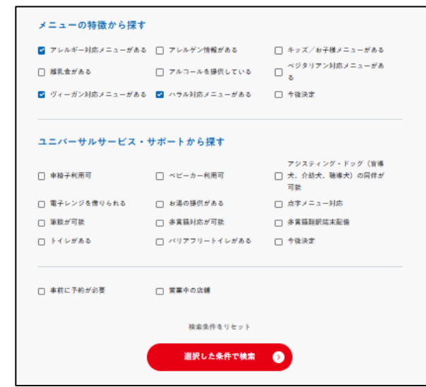
EXPO 2025 Visitors (万博公式アプリ)のグルメ検索画面

・企業・自治体・NGO・個人が連携する「共創チャレンジ」を通じた社会課題解決の模索