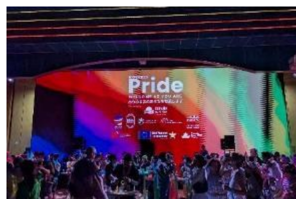
スペインパビリオン (イベントも開催)