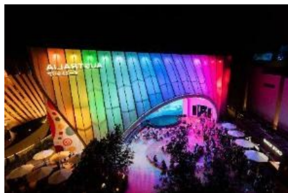
オーストラリアパビリオン