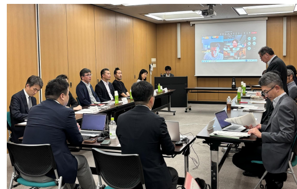
第1回有識者会議の様子