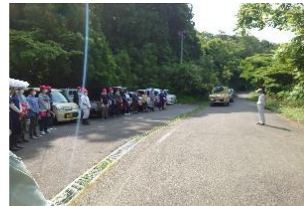
世界文化遺産の構成文化財 鶴子銀山にある唯一の駐車場