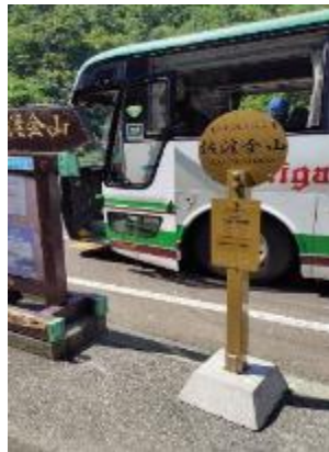
相川周遊バス 専用バス停