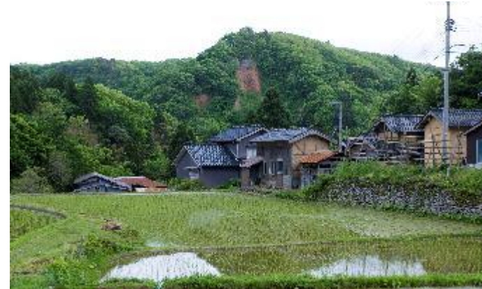
世界文化遺産の構成資産「西三川砂金山」