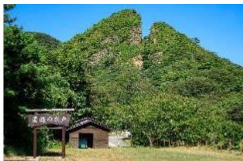
佐渡金山 道遊の割戸