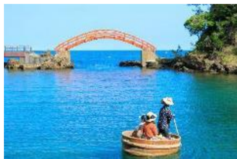
矢島経島 たらい舟