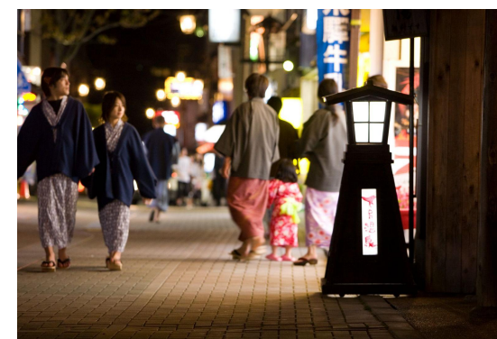
夜間には「夕食難民」も