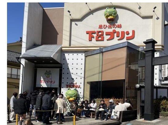
観光客が行列を作るスイーツ店