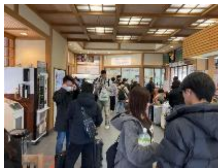
2 特急の到着時間前後には立つ人も出る下呂駅（住民も利用する）