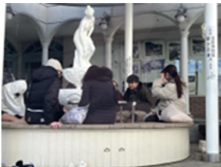
1 昼夜問わず人が押し寄せる足湯スポット