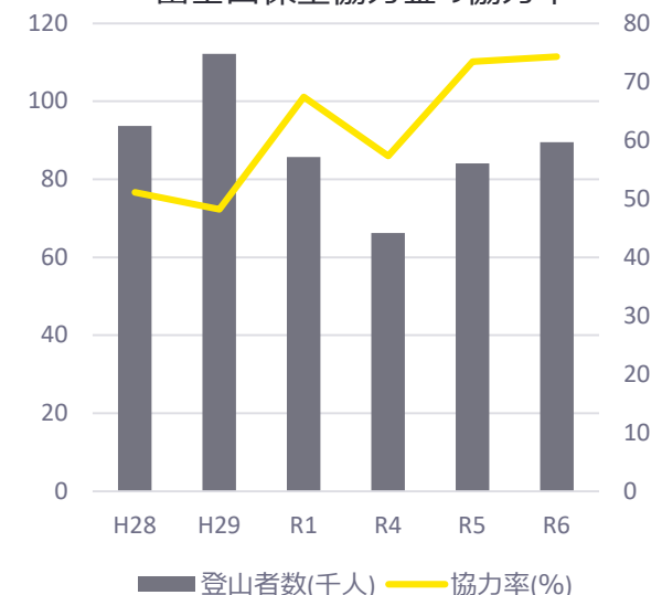
富士山保全協力金の協力率