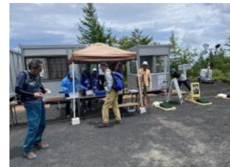
QRコード認証確認の様子