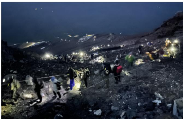
御来光目的の夜間における混雑状況