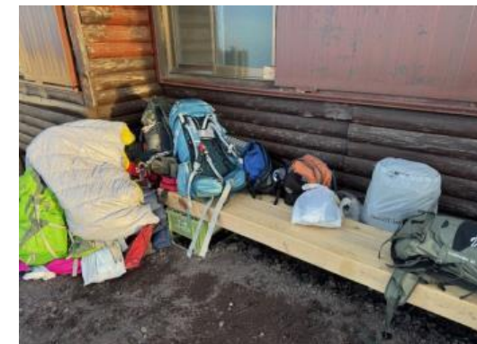
荷物を放置した登山