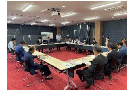
協議会・セミナー実施の様子