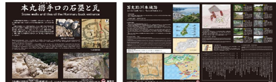
マナー情報掲載イメージ