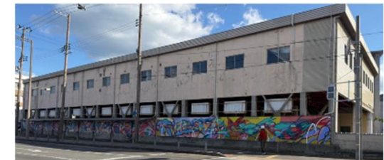
ミューラルアート制作