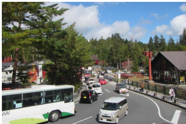
紅葉シーズンの交通渋滞様子