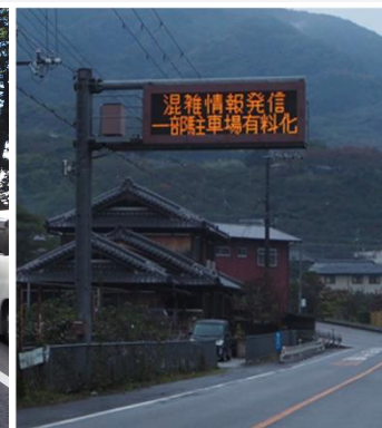
混雑情報 & 有料化案内