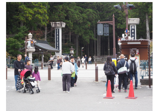
有料化した奥之院中の橋駐車場