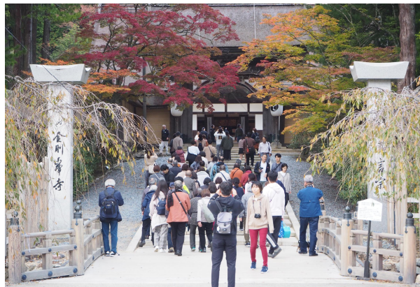
金剛峯寺を訪れる多くの観光客