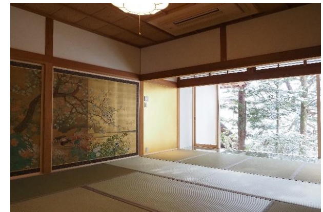
人気の高い宿坊の一室 ※高付加価値化事業を活用