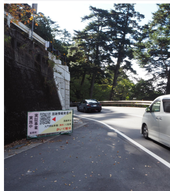
看板にQRコード掲載