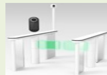
出入境通关便利化 (步行式自助通关闸机)