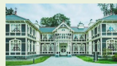
对外开放重要文化财 (旧三笠酒店)