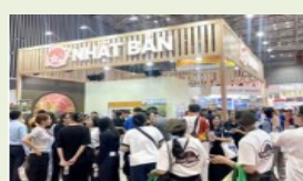
面向当地消费者的旅游博览会 参展与活动举办