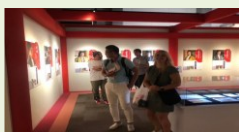
完善与当地渊源深厚的文化 财等展示设施