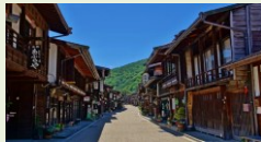
透過修繕歷史資源、電線桿地下 化及街景美化等完善街區風貌