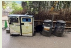
防治失禮行為的對策 (智能垃圾桶)