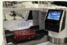
出入境通關便利化 (自助行李託運機)