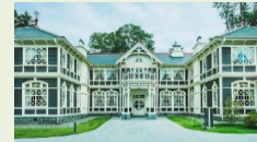
對外開放重要文化財 (舊三笠酒店)