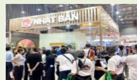
針對當地消費者的旅遊博覽 會參展與活動舉辦