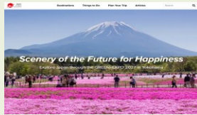
透過 JNTO(日本政府觀光局)特 設網頁發布園藝博覽會資訊