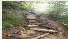
完善登山步道等設施