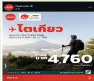
與航空公司聯合宣傳 推廣日本各地的魅力