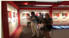
完善與當地淵源深厚的文化 財等展示設施