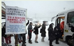
紓解擁擠的對策 (「停車轉乘 Park & Ride」實證實驗)