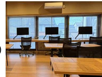
コワーキングスペース等の整備