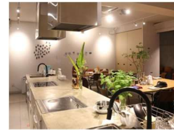
共同キッチン・ラウンジ等の整備