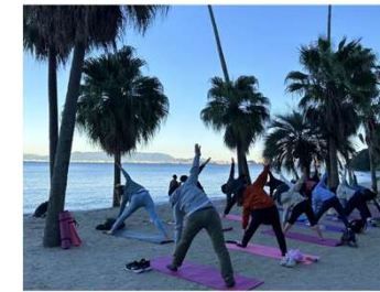
地域資源を生かしたアクティビティ