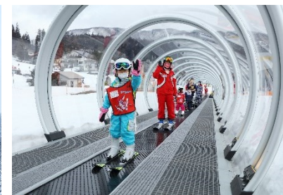
スノーエスカレーターの導入により、初心者・キッズ向けコースの利便性を向上