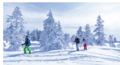
パウダースノーを活かしたガイドツアーの造成等により、消費額や滞在満足度の向上