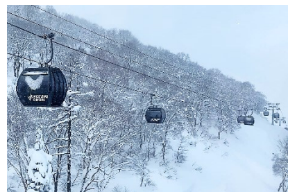
索道の更新に併せ、設置位置や滑走コースの構成を見直し、利便性・快適性を向上