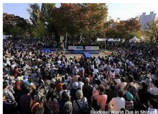
Daidogeij World Cup in Shizuoka