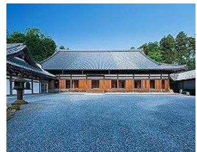
瑞巖寺本堂 (©瑞巖寺)