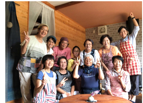
上: 移住者と民泊家庭の交流会