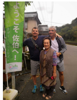
右: フランス人旅行者とホスト