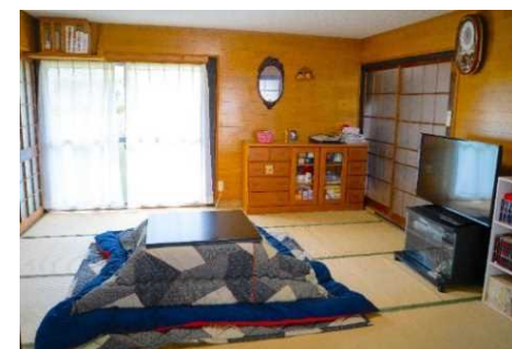
宿泊施設外観・内観