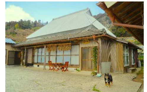
民家を活用した農泊施設