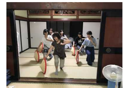
各家でできることから体験を実施。写真は地域内で小学生時代から習う民謡を宿泊客に伝えているところ。