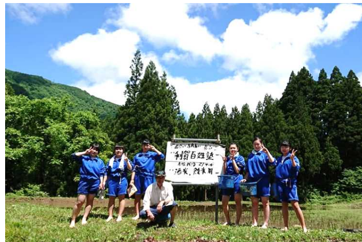
田植え体験をする修学旅行生たち