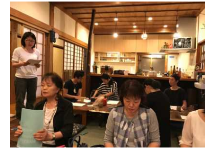
民泊参入検討者への説明会。近隣の新規ゲストハウスの見学とあわせて。