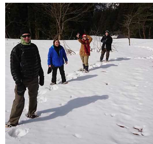
かんじき体験をする外国人旅行者