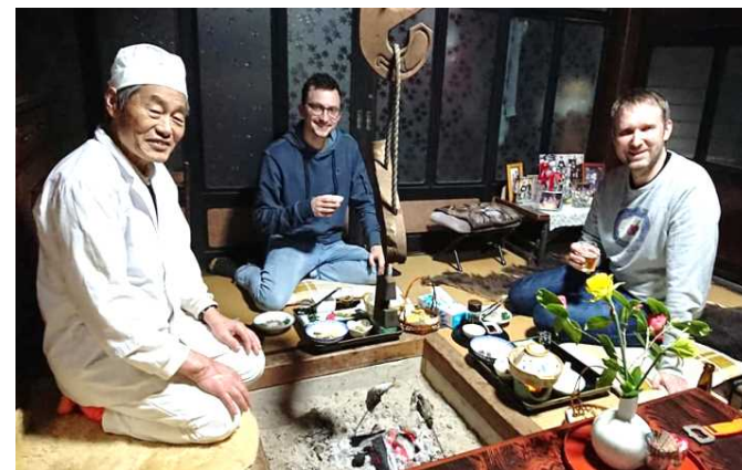
囲炉裏のある古民家