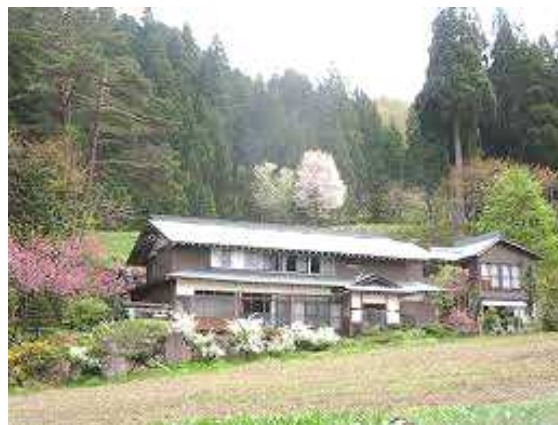
中の屋とまわりの環境