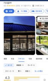
Googleビジネスプロフィール掲載例 (出典：ホテルryugon)