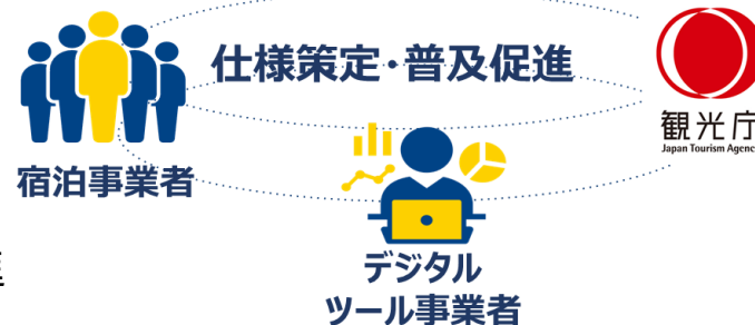
データ仕様の統一化・API化に向けた体制