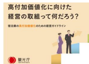
宿泊業の高付加価値化のための経営ガイドライン