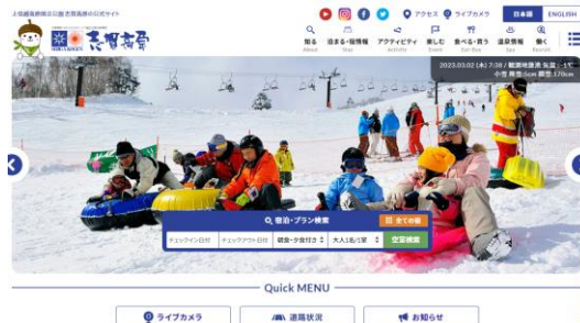
シームレスな情報発信・予約・決済が可能な地域サイト事例