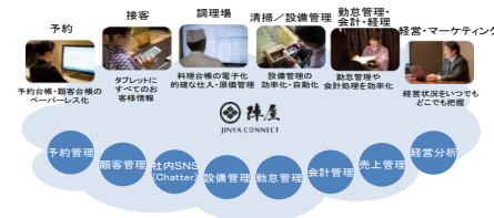
PMS等のデジタルツール導入による業務の効率化