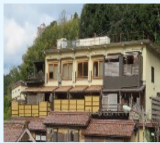
廃屋撤去・跡地利用 (イメージ)