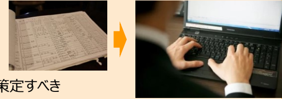
紙台帳等のアナログな管理に代わる顧客管理システムの導入

・紙台帳等に代わる顧客管理システム導入や一定の会計基準の遵守を盛り込んだ 企業的経営に関するガイドライン を策定すべき ・上記の ガイドラインに則った経営を行う事業者 について、 今後国として積極的に支援 すべき