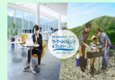
ワーケーションの普及