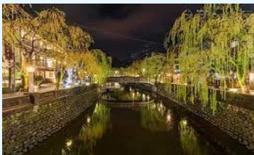
観光地の面的な再生 (イメージ)