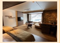
バリアフリー客室の整備

・個別の宿泊施設と自治体との 災害連携協定締結等 を促進すべき ・被災者等の受入先となる一定の宿泊施設における 耐震性強化や居室等のバリアフリー化等のハード整備 の支援を検討すべき