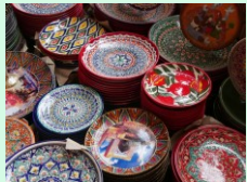
輸入品販売事業への事業展開