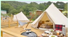
グランピング・キャンプ用品等のレンタル事業への展開