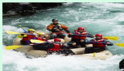
アドベンチャーツーリズム