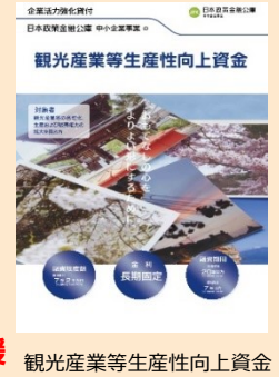
観光産業等生産性向上資金

・ 宿泊施設の改修や廃屋撤去 等の計画的・継続的な取組が可能となるよう支援内容を見直すとともに、 面的なDX化等 も支援対象とするなど 制度の拡充 を図るべき ・公庫による 観光産業等生産性向上資金等による金融支援を継続 するとともに、今後必要な制度見直しを検討すべき ・国際的に関心が高まっている SDGsへの対応に関する事項 についても ①のガイドラインに盛り込む べき