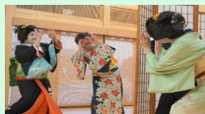
地域の観光資源を活かした商品造成