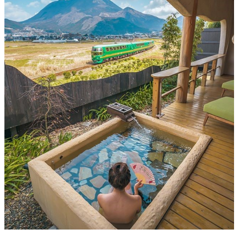
▲インフルエンサーによる実際の投稿写真