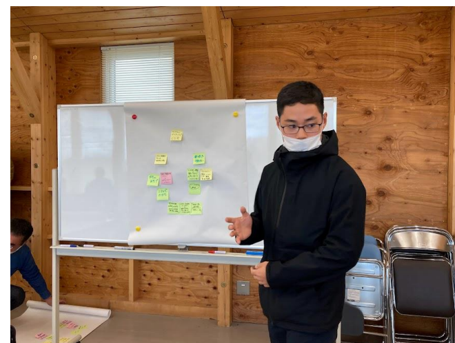
地域課題解決ワークショップ