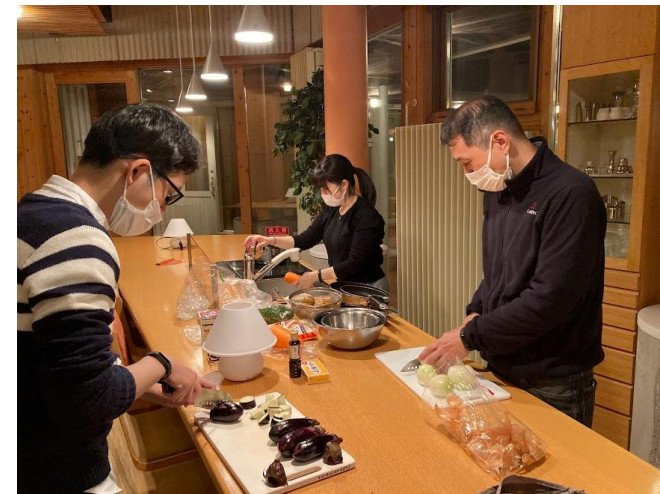
チームビルディングの取り組み