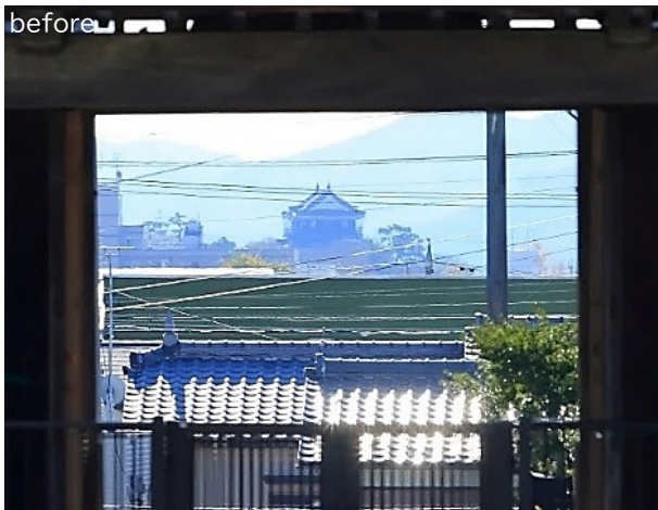
岡崎城に電線が直接かかっていた状態