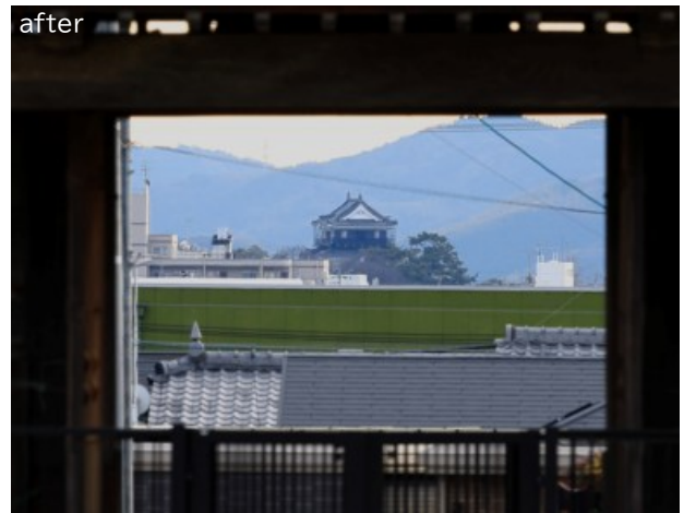
撤去が完了した後の視点場からの眺望