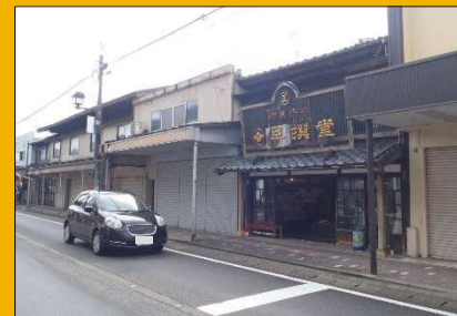
廃止前の街並み(修景事業実施前)

・都市計画道路が廃止された区間では、アーケードの撤去や沿道建築物の修景事業が進み、歴史的な街並み景観が向上した。