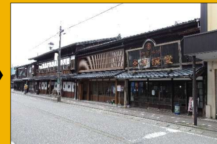
廃止後の街並み(修景事業実施後)

【沿道の建築物の状況】 大町・小町全体の建築物：97棟 都計道沿線の建築物：87棟 うち修景を行った棟数：42棟