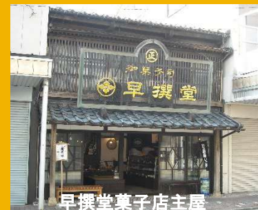
早撰堂菓子店主屋

・沿道における国の登録有形文化財の登録が進み、現在8件となり、歴史的建造物の維持・向上につながった。