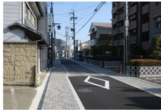
高質化を実施した街路