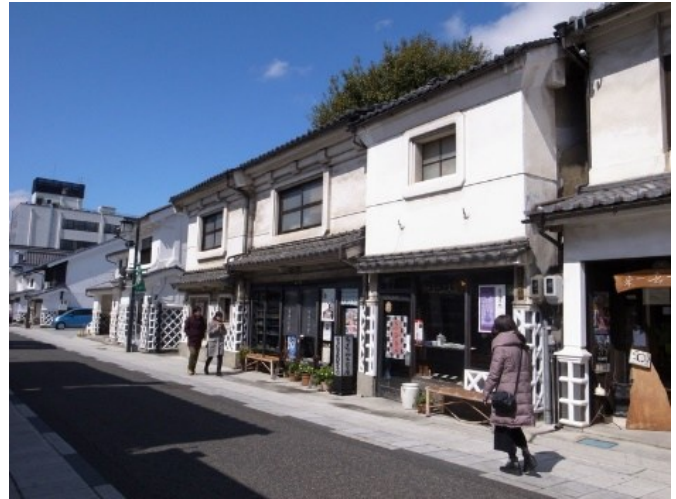
修景助成などにより歩いてみたい城下町に

松本市では、歴史まちづくり計画第1期の期間を中核とし、重点区域で「歩いてみたい城下町まちづくり事業」を実施した。街路舗装、水場、ポケットパーク等の整備と併せ、補助率 2/3、上限額300万円で建物の修景補助を行い、住民、事業者、行政等が各々の役割を担いながら、歴史的風致の向上が図られてきた。