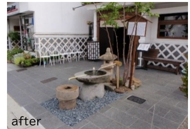
個人所有の井戸の修景