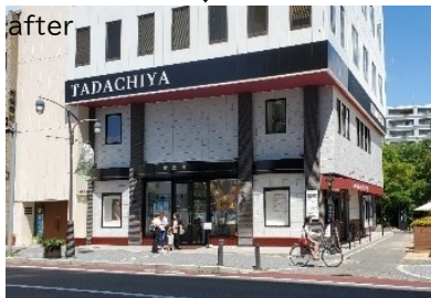
商業ビル低層部の修景(街路との関係を重視など)