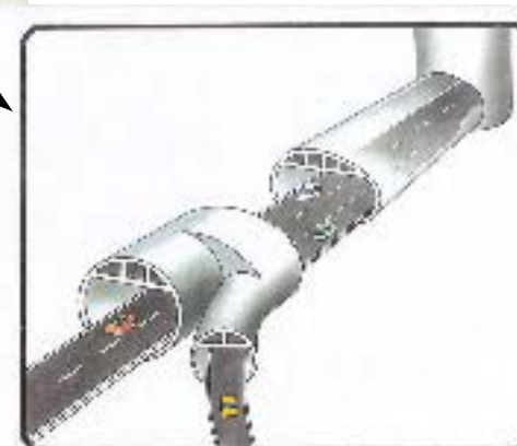
図 5-19 技術開発項目の大深度地下利用施設における活用のイメージ