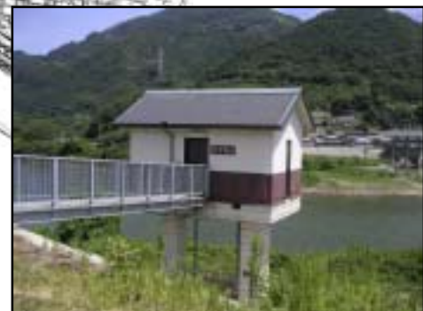
樋門上屋改修のイメージ