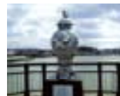
きたまつうら 北松浦地域 (伊万里焼)