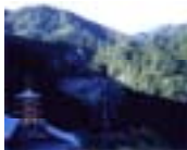
きい 紀伊地域 (那智の大滝)