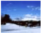
おしま 渡島地域 (大沼・駒ヶ岳)