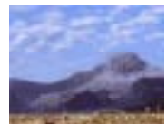
しまばら 島原地域 (雲仙普賢岳)