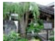
むらつおおしま 室津大島地域 (白壁の町並み)