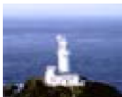
さだみさき 佐田岬地域 (佐田岬灯台)