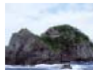
いずちゅうなんぶ 伊豆中南部地域 (石廊崎先端)