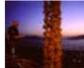
えのうくらはしじま 江能倉橋島地域 (カキ)