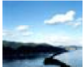
たんご 丹後地域 (天橋立)