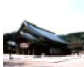
しまね 島根地域 (出雲大社)