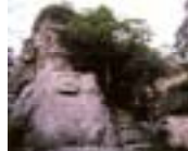
くにさき 国東地域 (熊野磨崖仏)