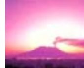
おおすみ 大隅地域 (桜島)