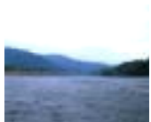
はた 幡多地域 (四万十川)