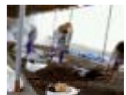
さつま 薩摩地域 (砂むし温泉)