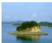
うとあまくさ 宇土天草地域 (天草松島)