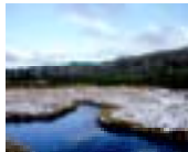
しゃこたん 積丹地域 (神仙沼)