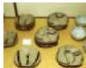
ひがしまつうら 東松浦地域 (唐津焼)