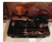
のと 能登地域 (輪島塗)