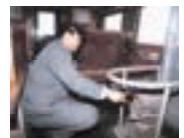
つがる 津軽地域 (ストープ列車)