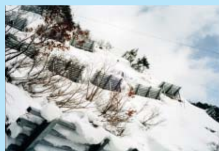
雪崩予防柵 (福島県耶麻郡西会津町)