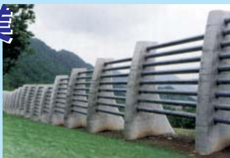
雪崩防護工 (新潟県中魚沼郡津南町)

●砂防工事建設現場などでも雪崩が発生する可能性があります。十分に注意してください。