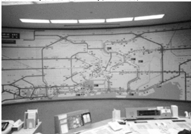
首都高速道路公団交通管制センター(国土交通省資料)