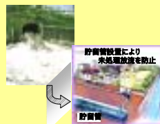
合流式下水道の改善

環境モニタリング(水質測定、人工衛星を利用した赤潮等の常時監視等) 市民参加型の環境イベント(海浜清掃など) など