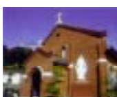
にしそのぎ 西彼杵地域 (黒崎教会)