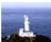
さだみさき 佐田岬地域 (佐田岬灯台)