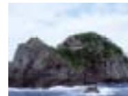
いずちゅうなんぶ 伊豆中南部地域 (石廊崎先端)