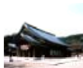
しまね 島根地域 (出雲大社)