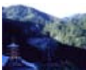
きい 紀伊地域 (那智の大滝)