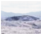
しちきた 下北地域 (恐山)