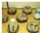
ひがしまつうら 東松浦地域 (唐津焼)