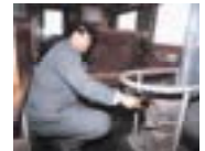
つがる 津軽地域 (ストープ列車)