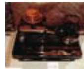
のと 能登地域 (輪島塗)