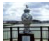
きたまつうら 北松浦地域 (伊万里焼)