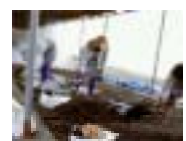
さつま 薩摩地域 (砂むし温泉)