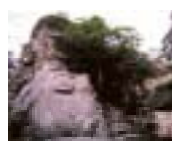
くにさき 国東地域 (熊野磨崖仏)