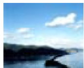
たんご 丹後地域 (天橋立)