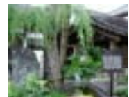
むろつおおしま 室津大島地域 (白壁の町並み)