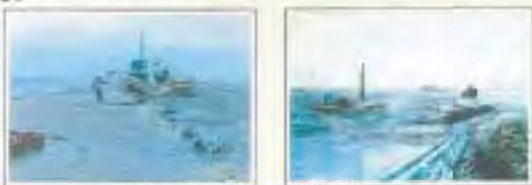
昭和60年高潮被災状況(住ノ江区)