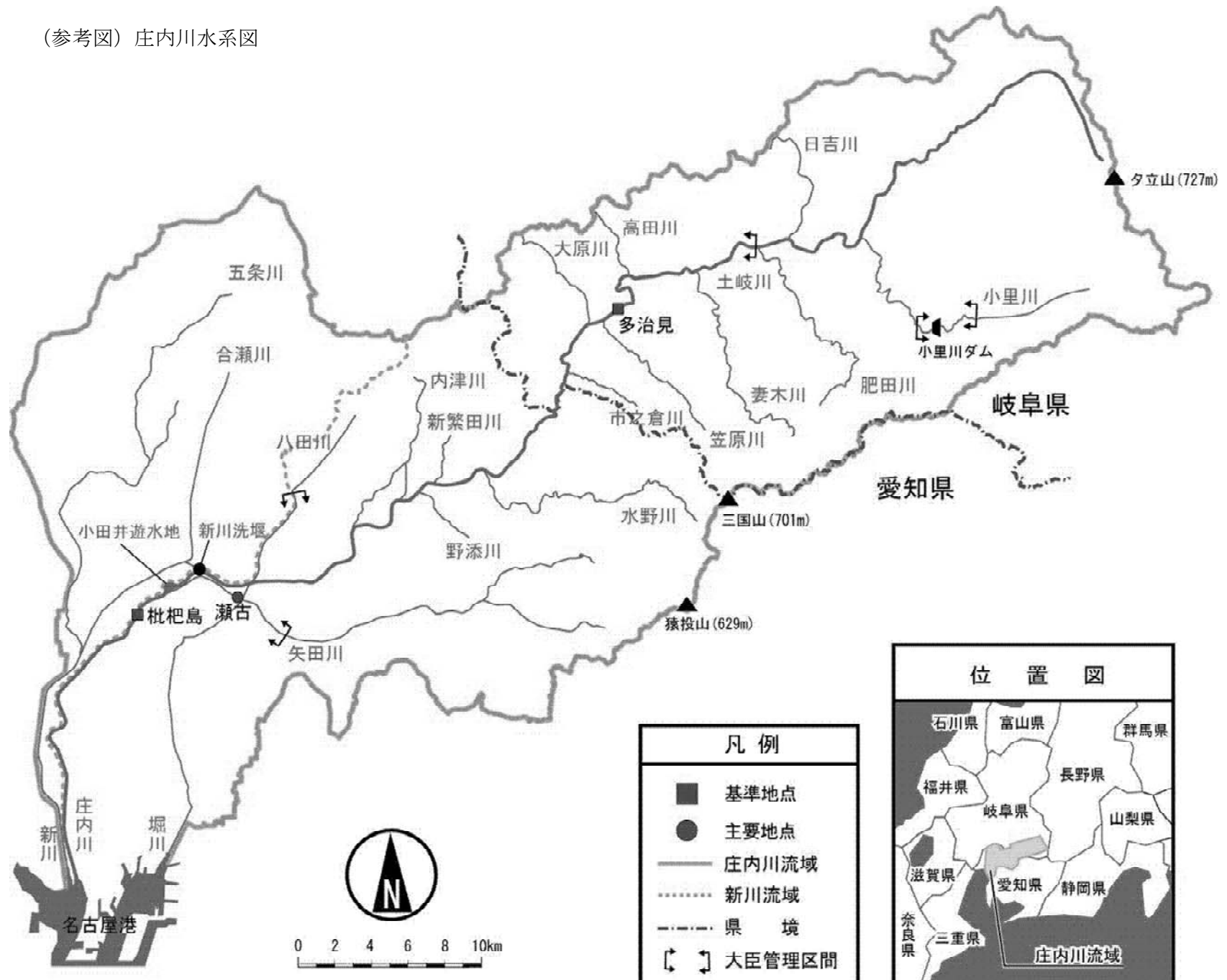
(参考図) 庄内川水系図