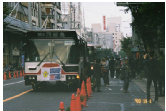
「トランジットモール」社会実験 (岐阜県岐阜市)