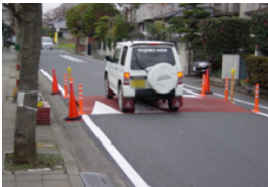
「くらしのみちゾーン」社会実験 (千葉県鎌ヶ谷市)