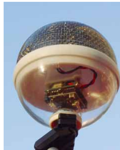
球状太陽電池を使用した無線マーカ

環境に配慮した、太陽電池で駆動する無線マーカを会場内に設置し、無電源で動作する場所情報システムの実験を実施します。この無線マーカは、小型アクティブチップ「pT-Engine」に、発電効率の優れた球状太陽電池を組み合わせたものを使用します。