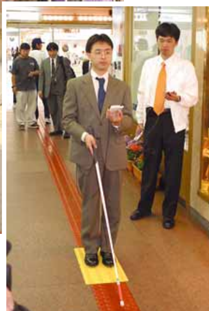
点字ブロックによるナビゲーション （神戸プレ実証実験より）