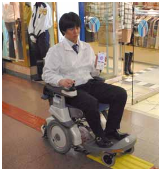
車いすでの利用（神戸プレ実証実験より）

ゲートからパビリオンに向かって敷設された視覚障害者用の点字ブロックの要所要所に IC タグを内蔵します。利用者は専用の白杖により IC タグの場所情報を読み取り、携帯端末「ユビキタスコミュニケーションータ」よりナビゲーション情報を取得します。また本システムは、車いすに IC タグリーダを備え付けることにより、車いすの使用者からも利用が可能となります。