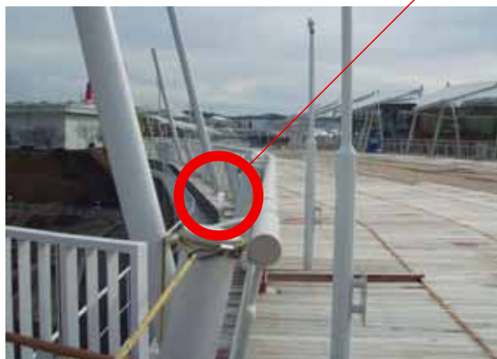
グローバル・ループ上の無線マーカの位置