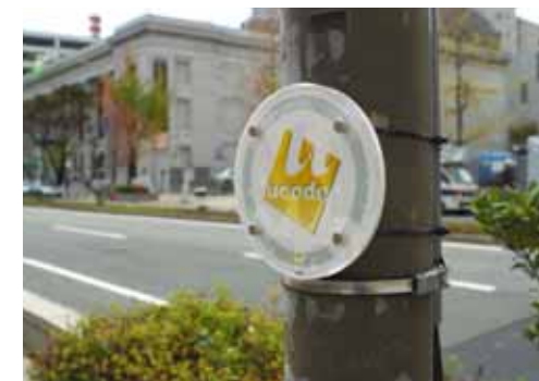
神戸プレ実証実験におけるICタグの利用