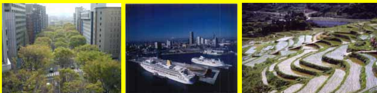
良好な景観形成に資する公共事業の実施